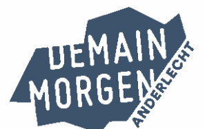
F. EL IKDIMI